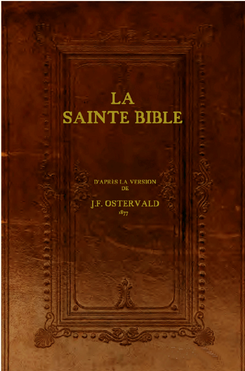
BIBLE OSTERVALD DE 1877